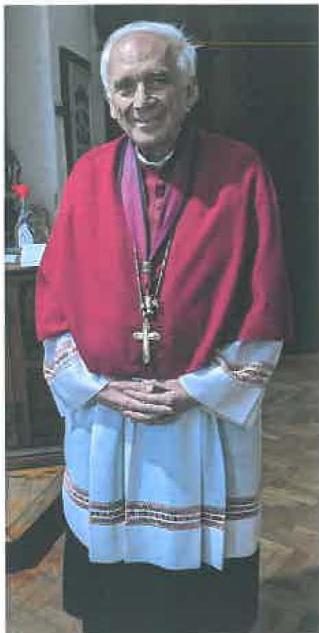
oděv děkana kapituly